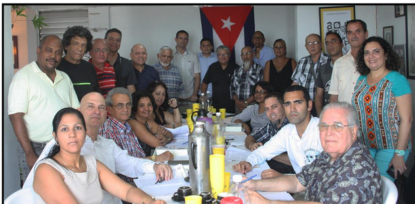
Participantes en ESPACIO ABIERTO que aprobaron "Un camino ético para Cuba".

162 aniversario de la muerte del Padre Félix Varela